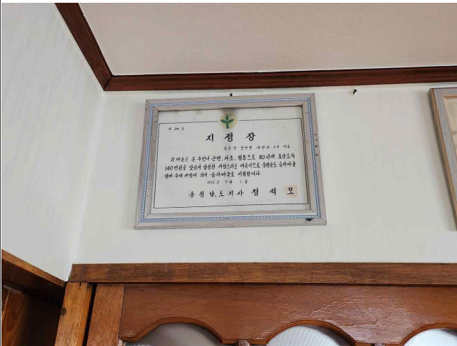
충청남도지정 호당 소득증대 승자마을 지정