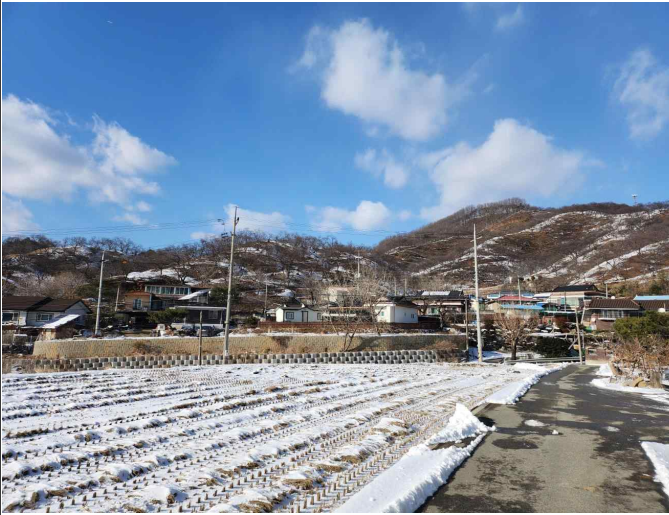
농업 및 농촌 경관