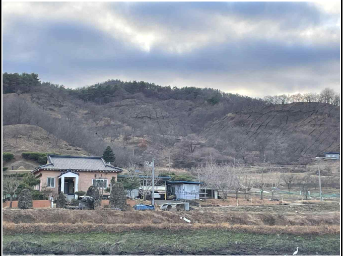
농업 및 농촌 경관(2)