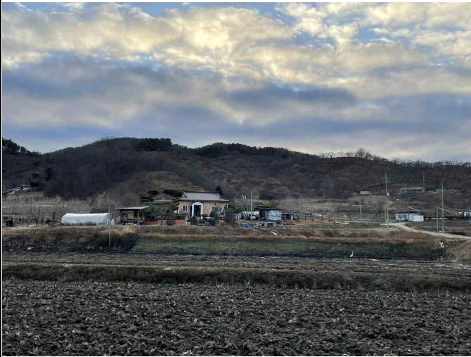
농업 및 농촌 경관