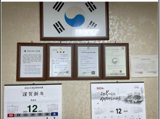
상정안(2반) 마을회관 지정서들