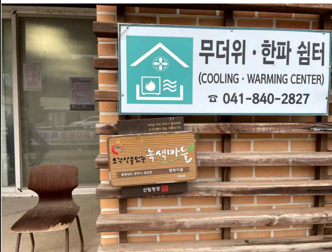
상정안(2반) 마을회관 현판