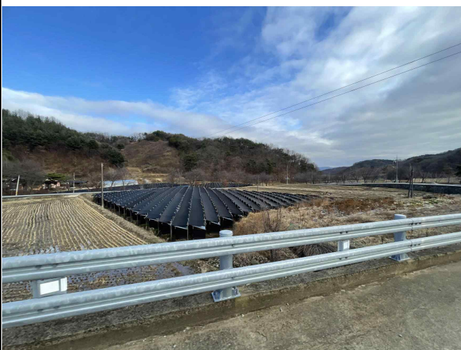
동막골(3반) 농업 경관