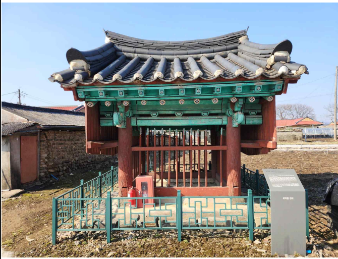
효자 최익항 정려