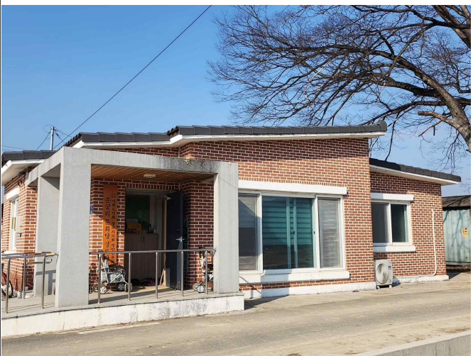
운궁리 문화당 경로당