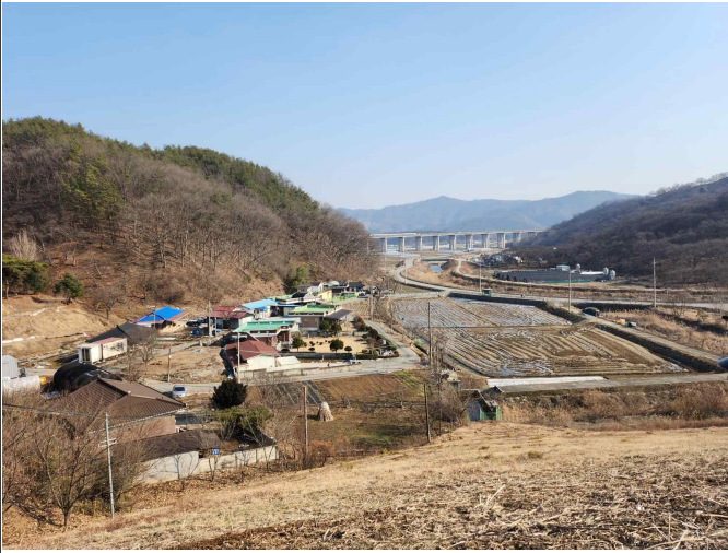
농촌 및 농업경관 (은학골)