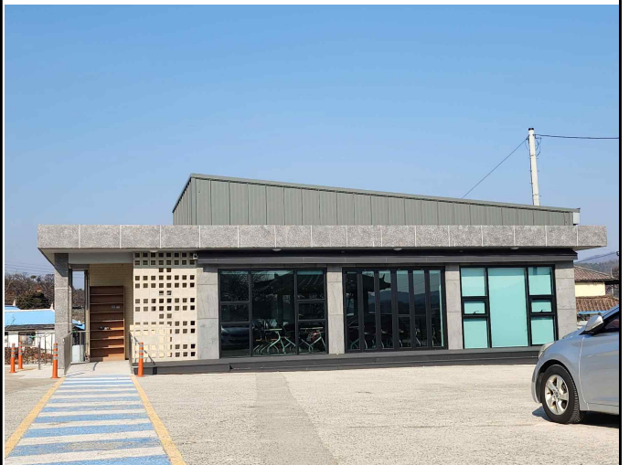
운궁리 경로당 회의실