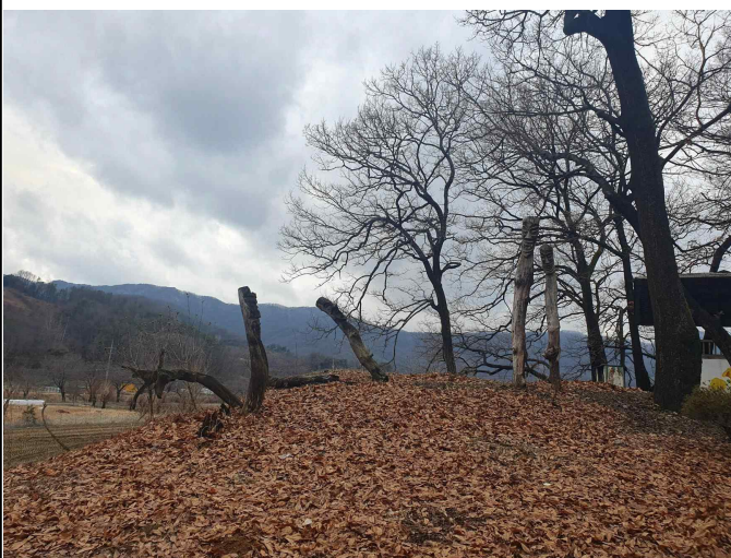
마을 입구 장승