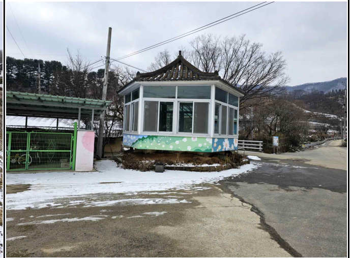
마을회관 옆 정자