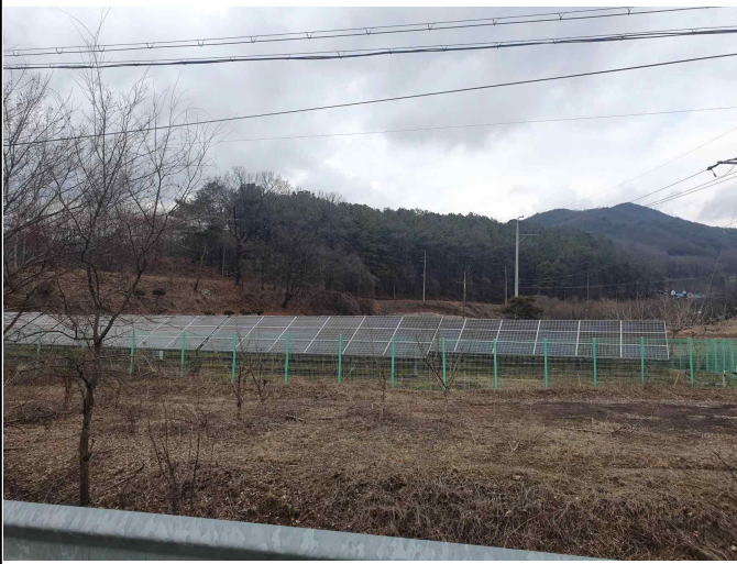
마을 태양광 단지(개인 소유)