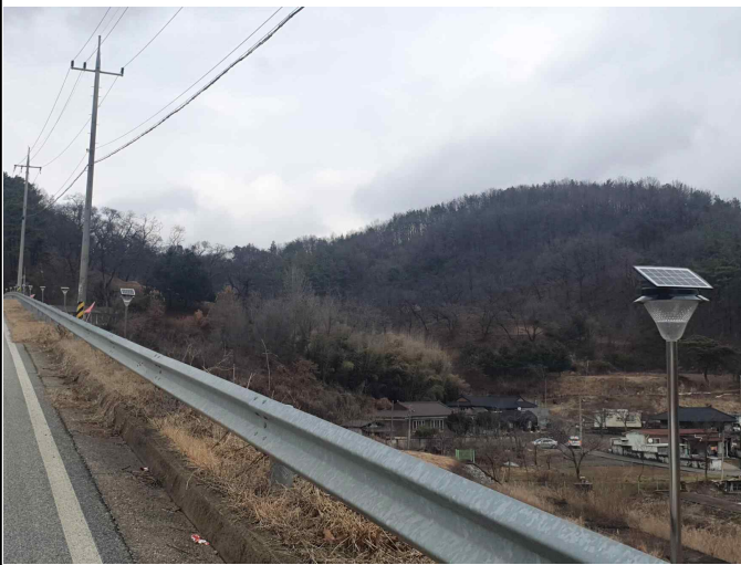
고성저수지 사면 태양광가로등