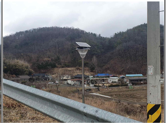
고성저수지 사면 태양광가로등(2)