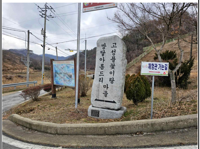
고성리 마을 입구