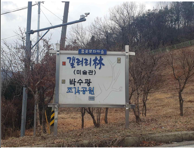
마을 문화시설 안내판