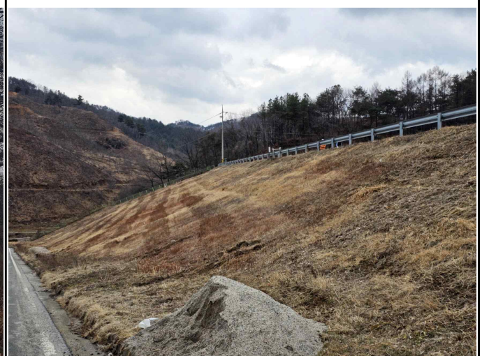
고성저수지 뚝방 사면(할미꽃 군락지)