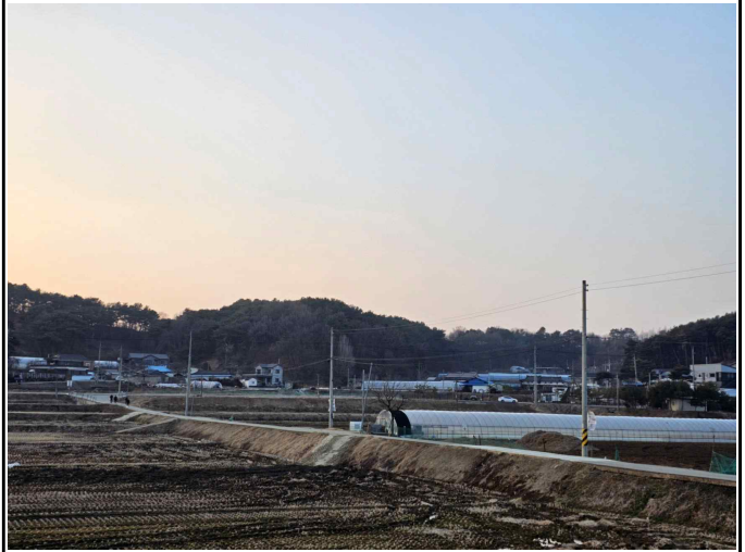
농업 및 농촌 경관