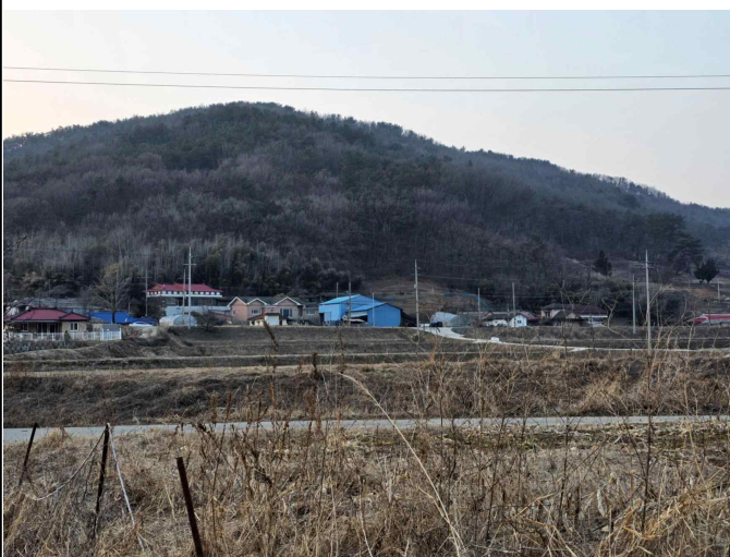
농업 및 농촌 경관