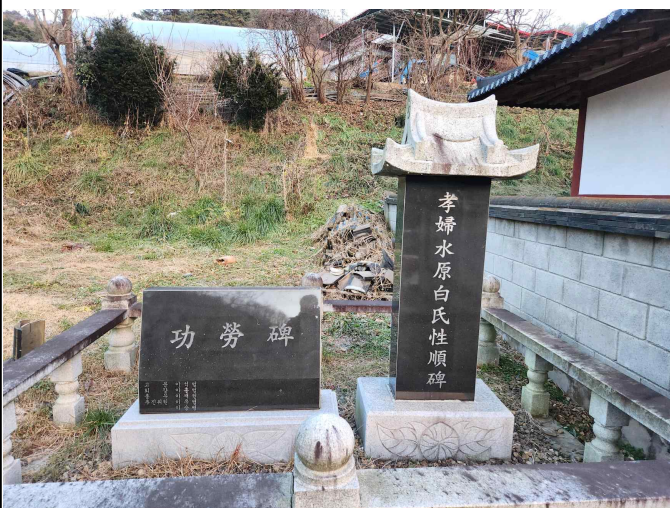
함평이씨 재실 공로비