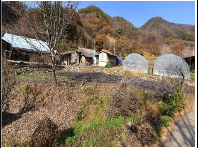
농업 및 농촌 경관