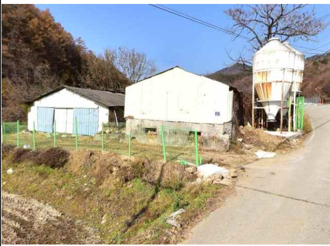
화양회관 앞 축사