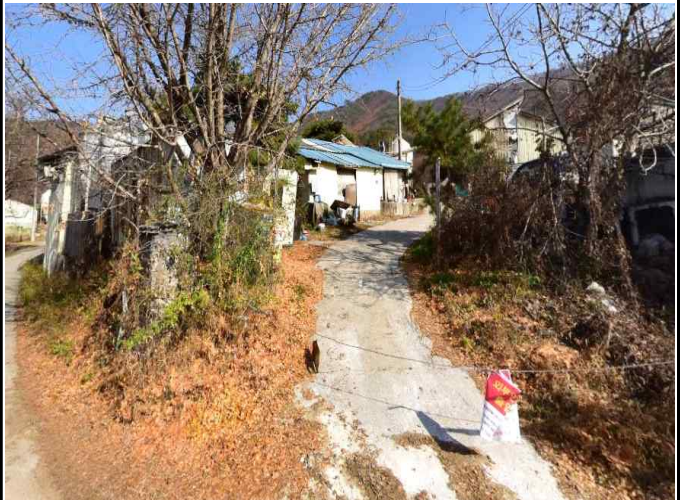
화양회관 앞 축사(2)3