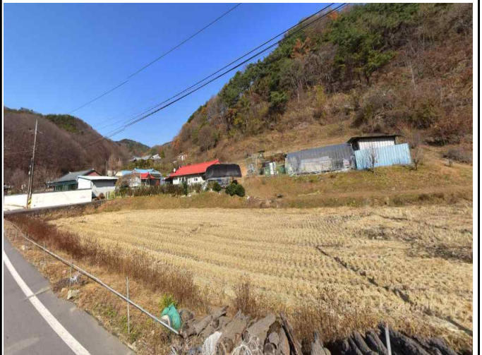
농촌 및 농업 경관