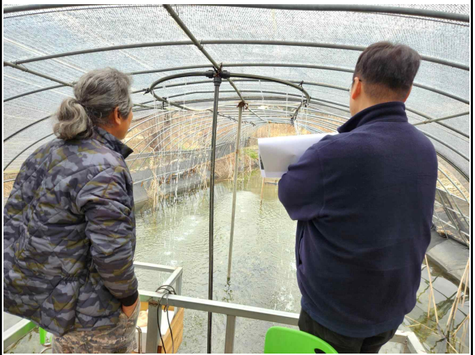
회관 건너편 실내낚시터