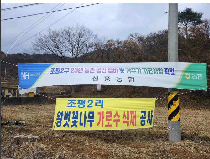
농협 지원 정비사업 현수막