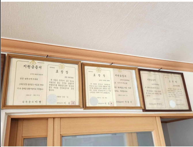
마을회관 내 증서들