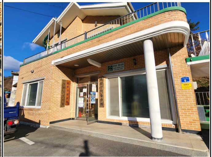
마을회관 및 경로당