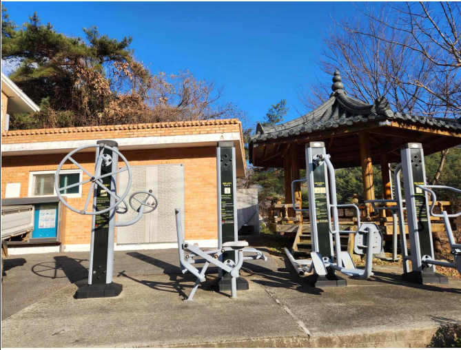
마을회관 옆 운동기구