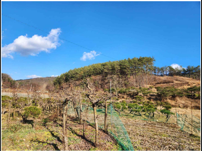
소나무군락지 및 조경수