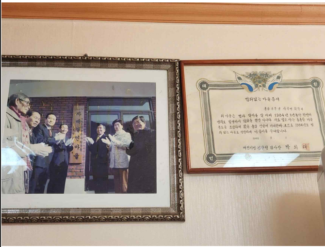
환경부 자매결연 사진