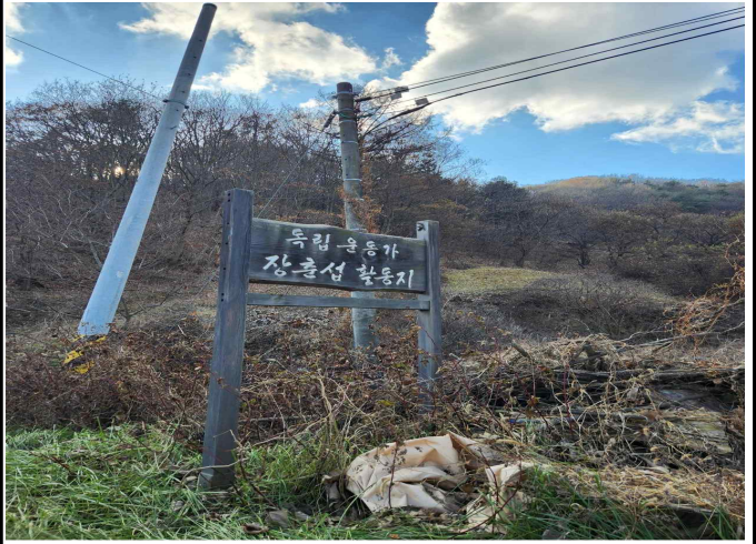
독립운동가 장춘섭 표지판