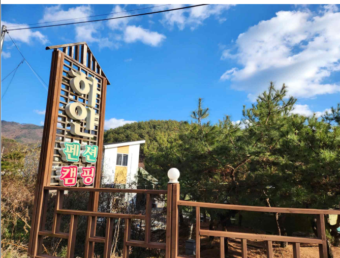
마을 내 개인사업체