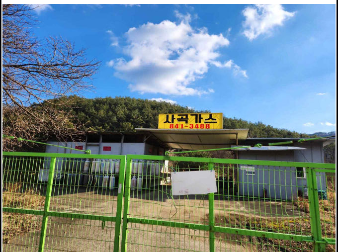
마을 내 개인사업체(2)