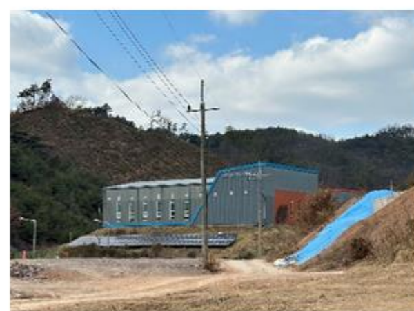
2 백제 양수장