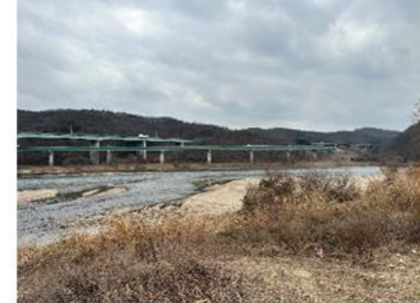
4 금강 모래톱