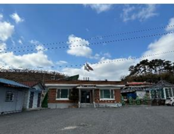
1 옥성2리 마을회관