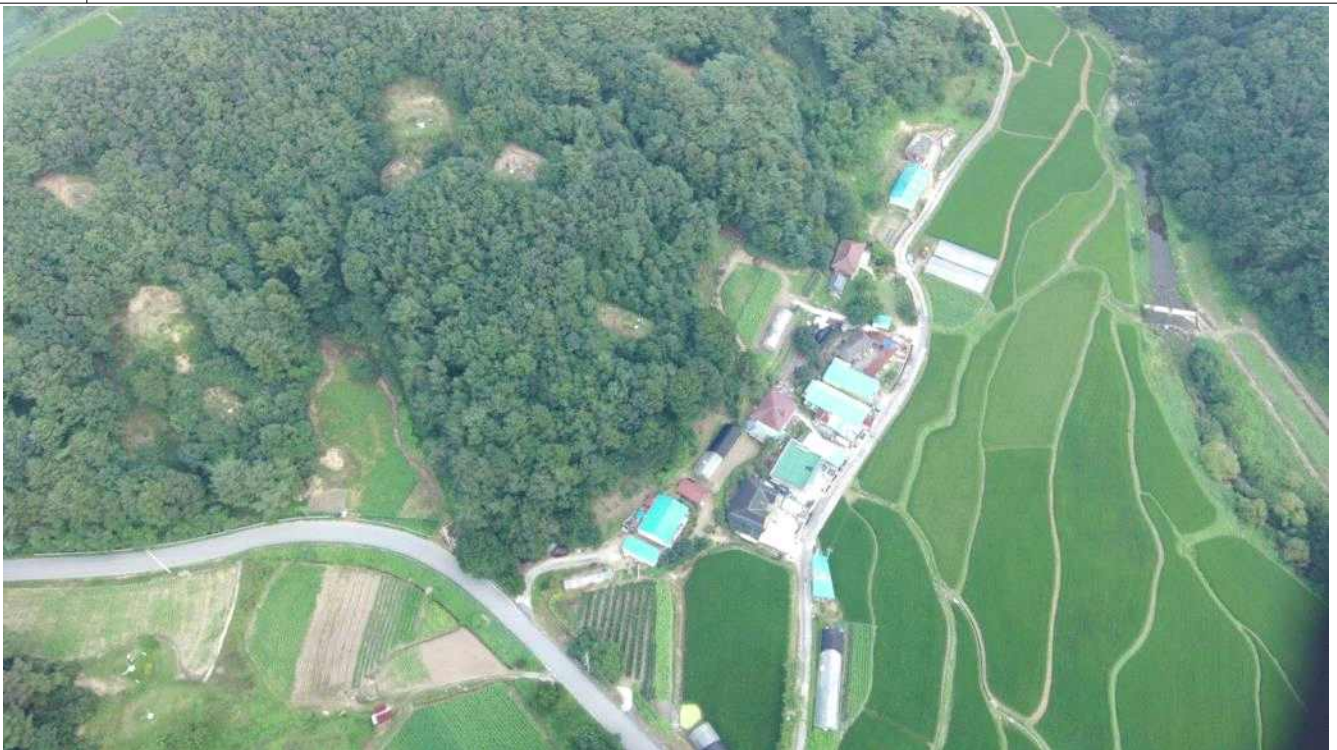
자원 마을 주요시설이 밀집한 위치의 전경