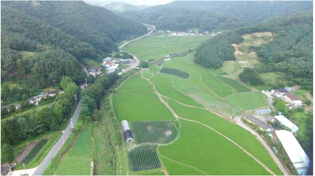
자원 연중리의 농지 전경