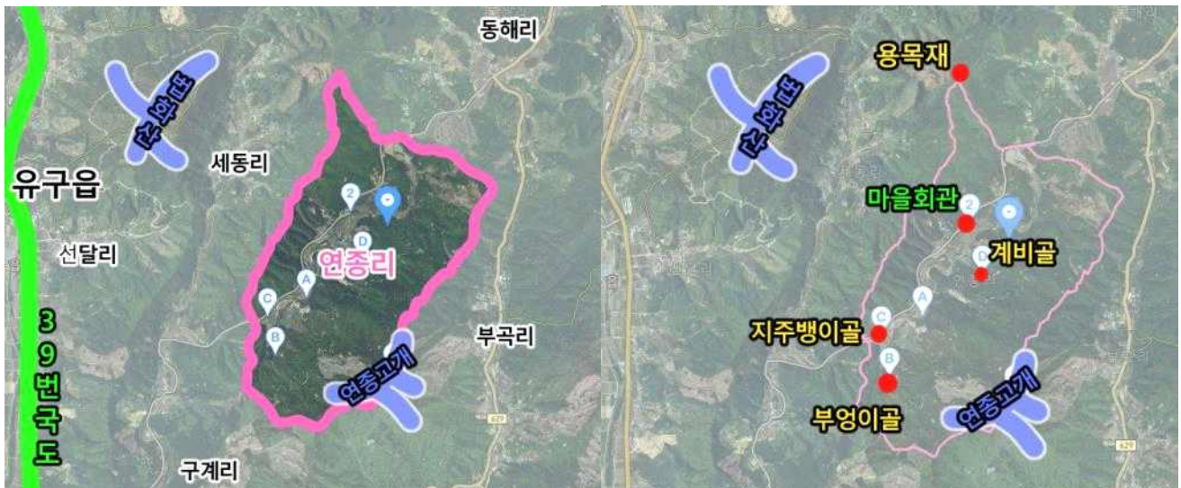
▲연종리 마을 위치도(카카오맵)