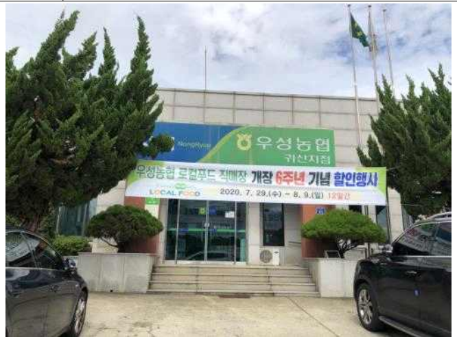
자원 우성농협 귀산지점