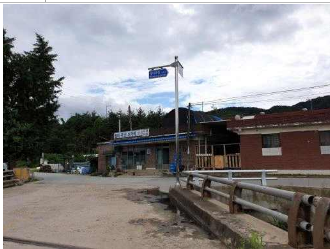
자원 월미 귀산삼거리 상회