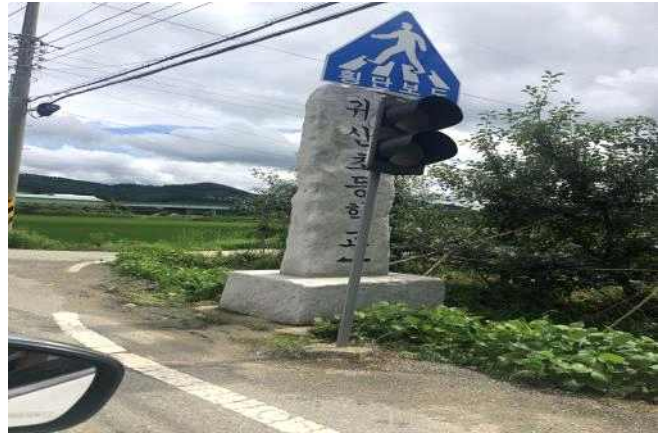
자원 귀산초등학교 입석