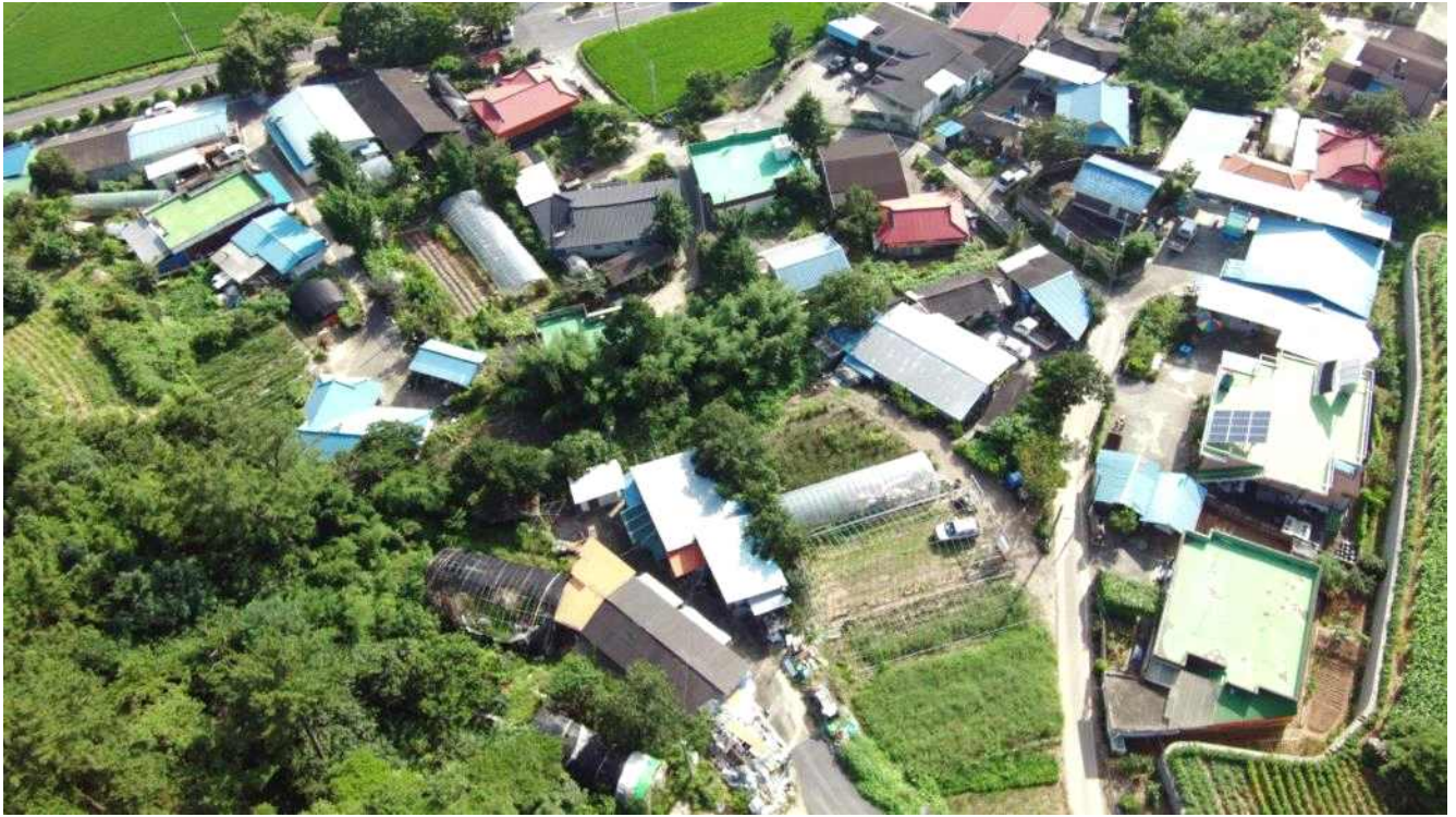
자원 마을의 주요시설과 주거지역이 밀집해 있는 위치의 전경