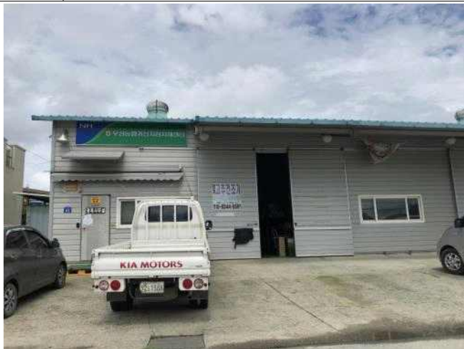
자원 우성농협귀산지점 자재센터