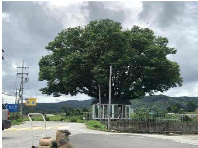
자원 마을 가운데에 위치한 느티나무