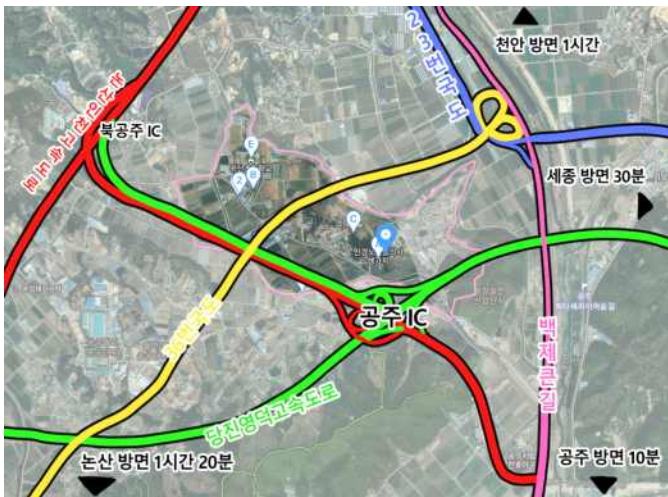
▲동원1리 교통지리도 (카카오맵)