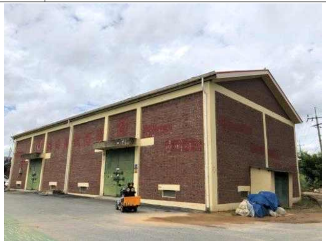
자원 귀산리 저온저장고