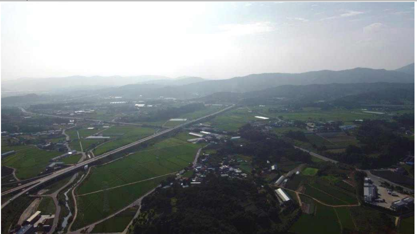
자원 주요 생활지역과 농지의 전경