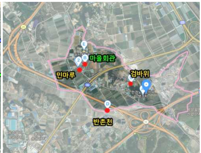
▲동원1리 자연 마을 (카카오맵)