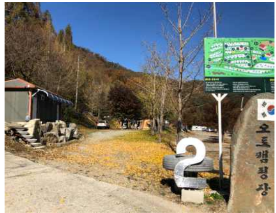
사계절 오토 캠핑장