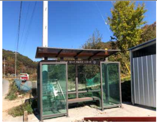
마을회관 앞 버스정류장