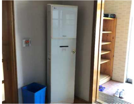
회관 내부 에어컨