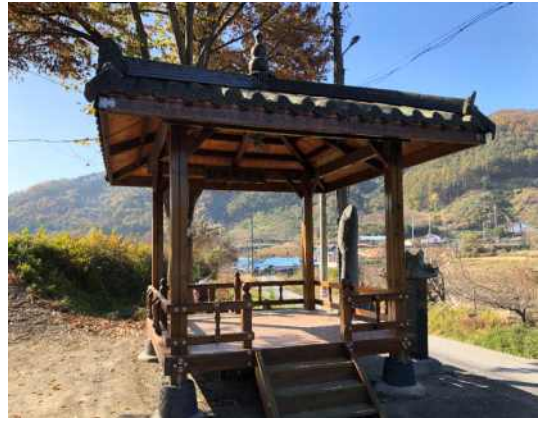
마을회관 앞 정자