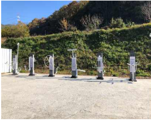
마을회관 앞 운동시설