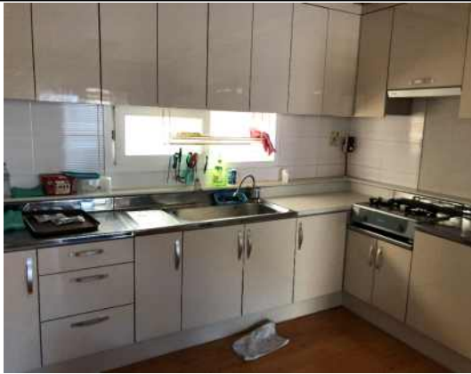
회관 내부 주방