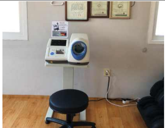
회관 내부 혈압측정기