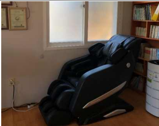
회관 내부 안마기 및 공기청정기